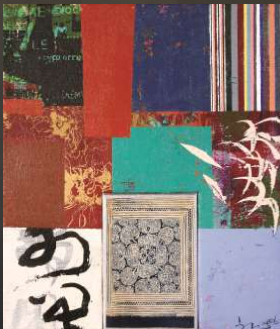
觀修慈悲西藏行 46x53cm 複合媒材