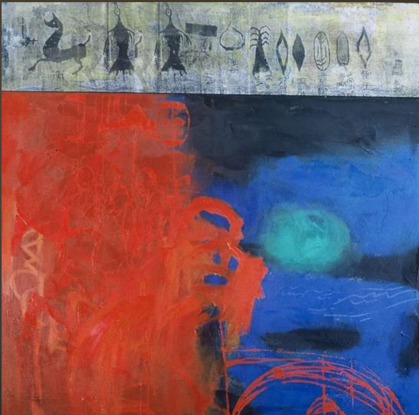
永徽系列 120x120cm 複合媒材