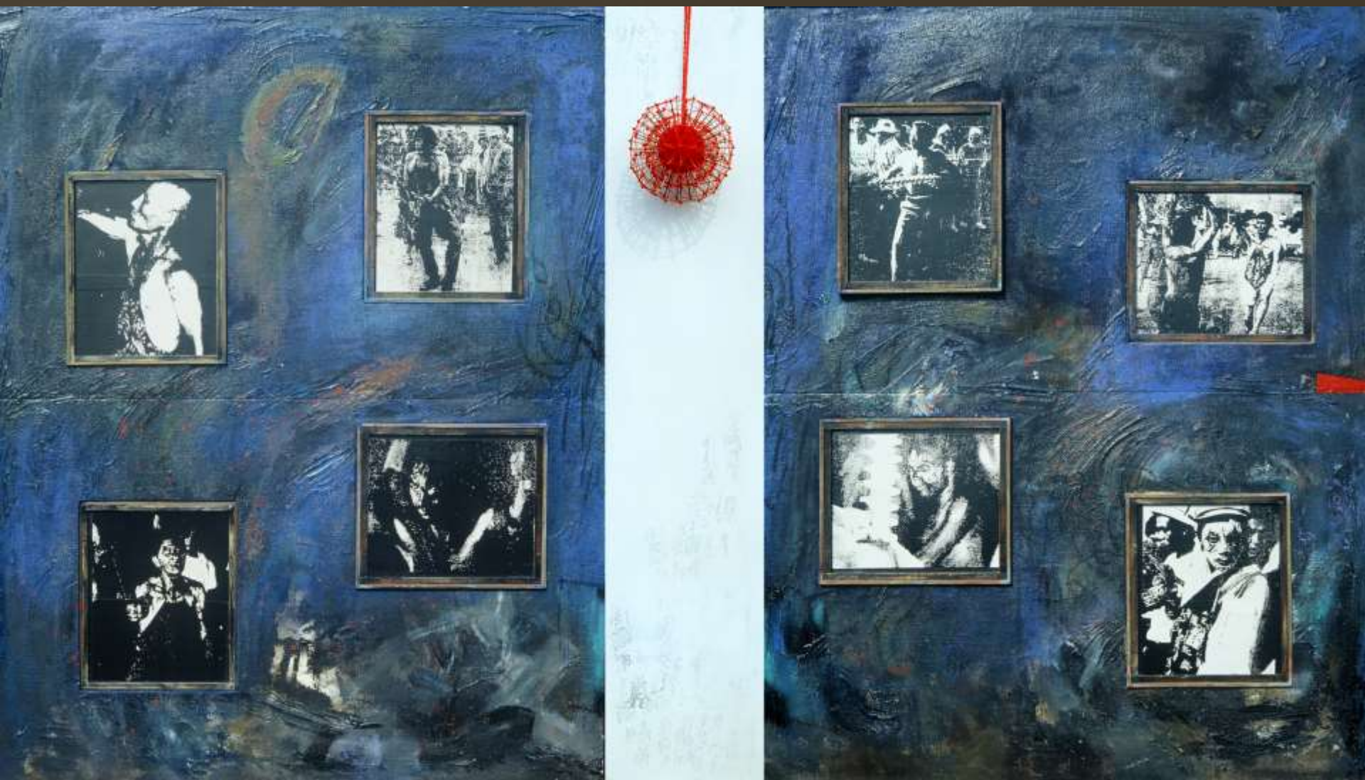
忘了我是誰183x328cm 複合媒材