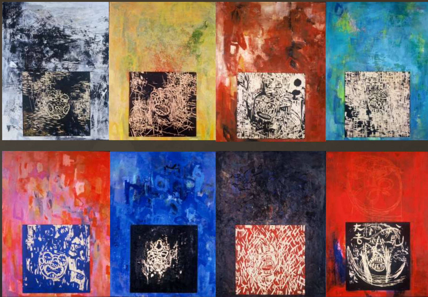
民俗 (8件連作)182x292cm 複合媒材