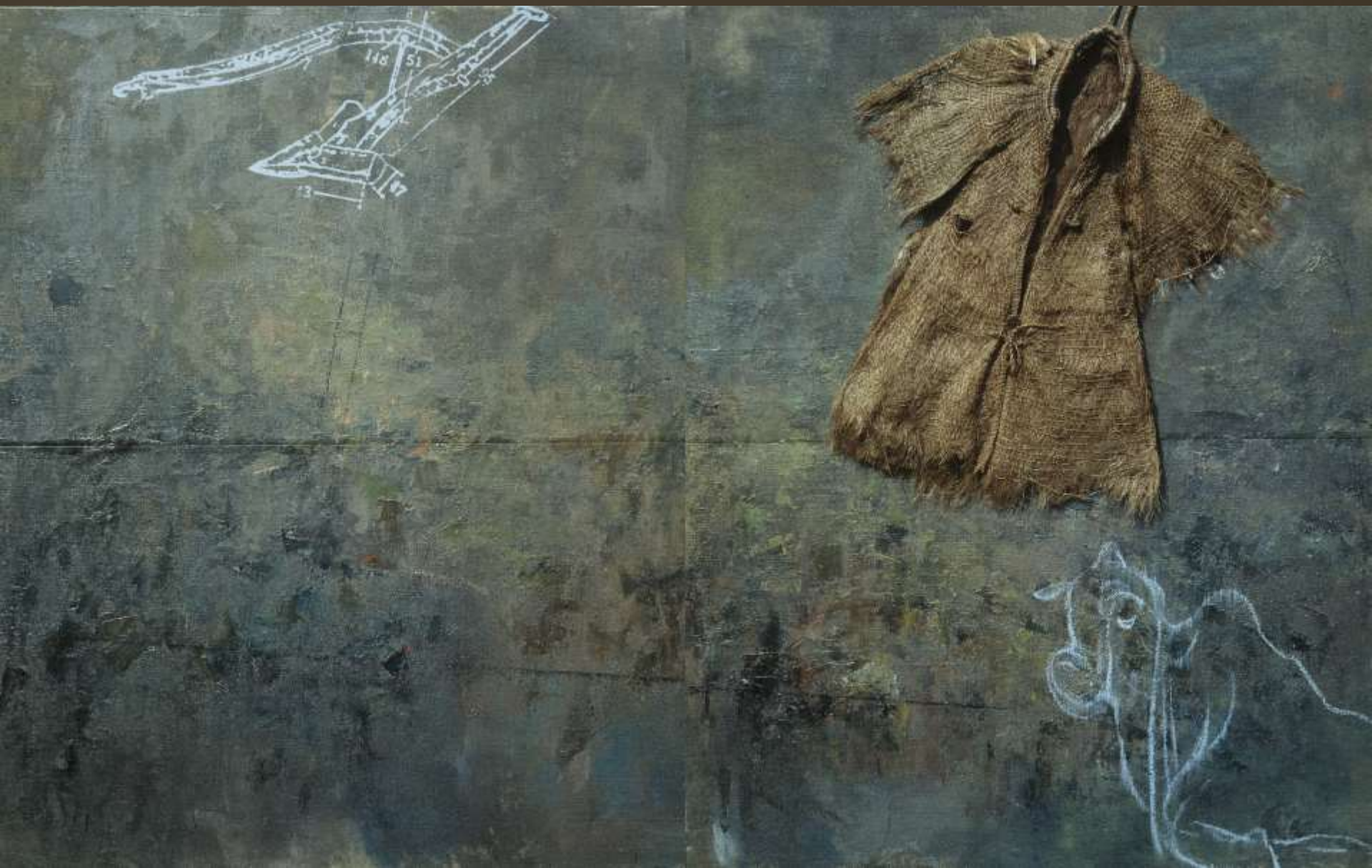
農夫 183x290cm 複合媒材