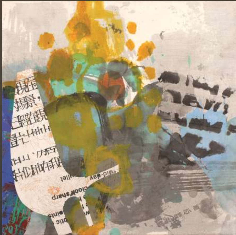
自然而然 60x60cm 複合媒材