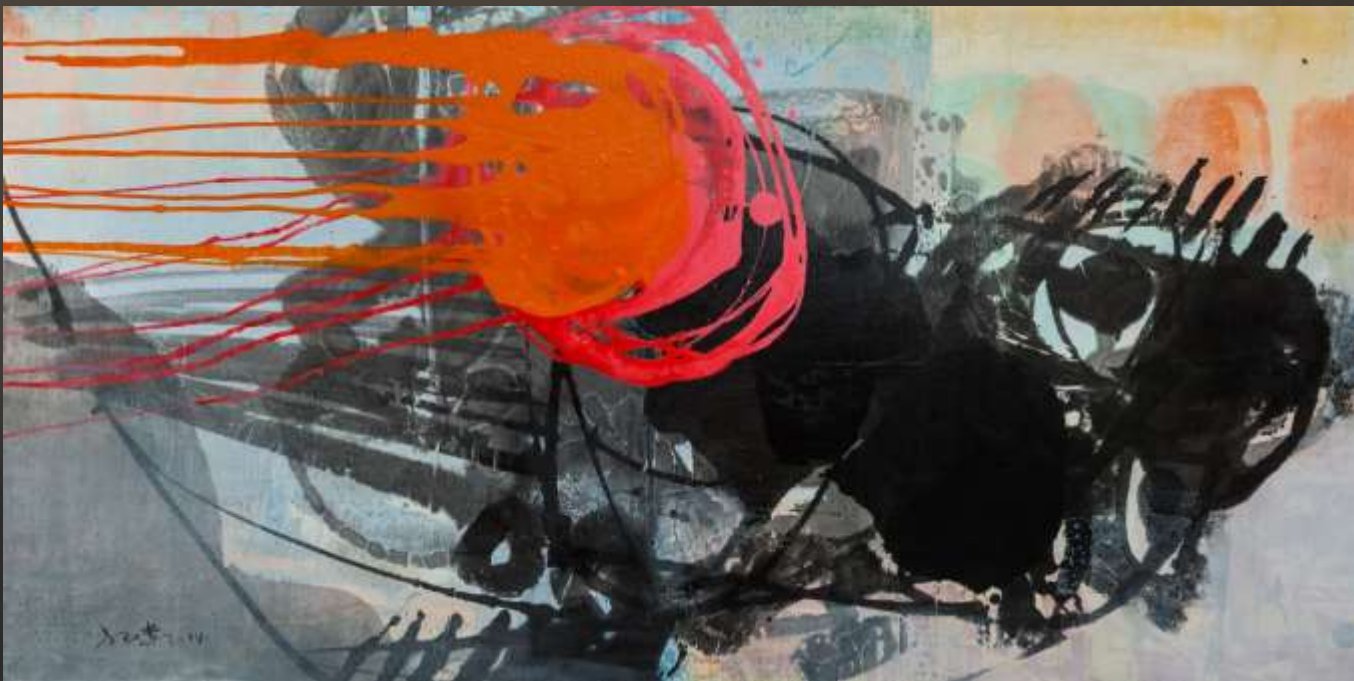
日月得天 90X180cm 複合媒材