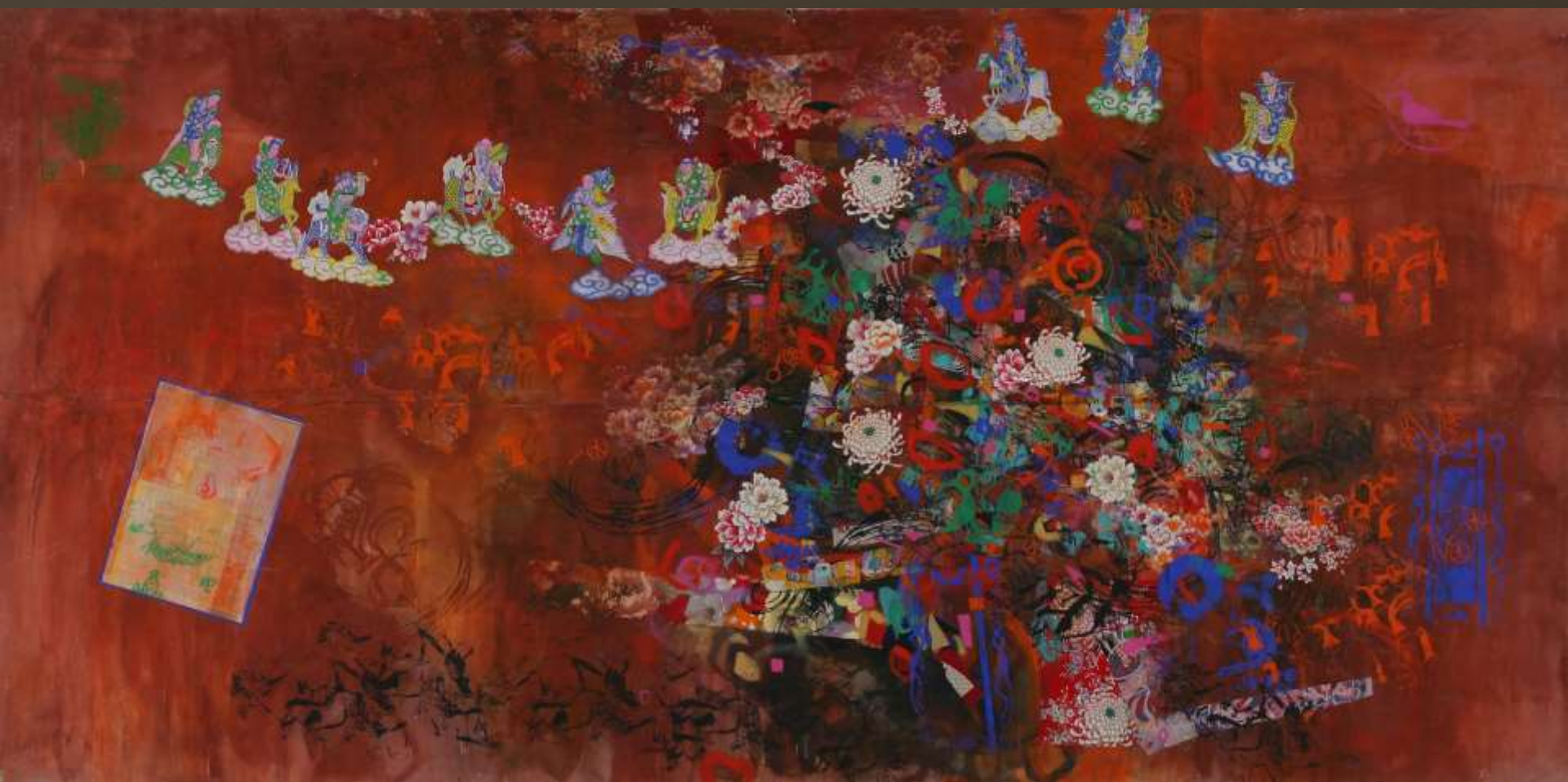
逗熱鬧 250x450cm 複合媒材