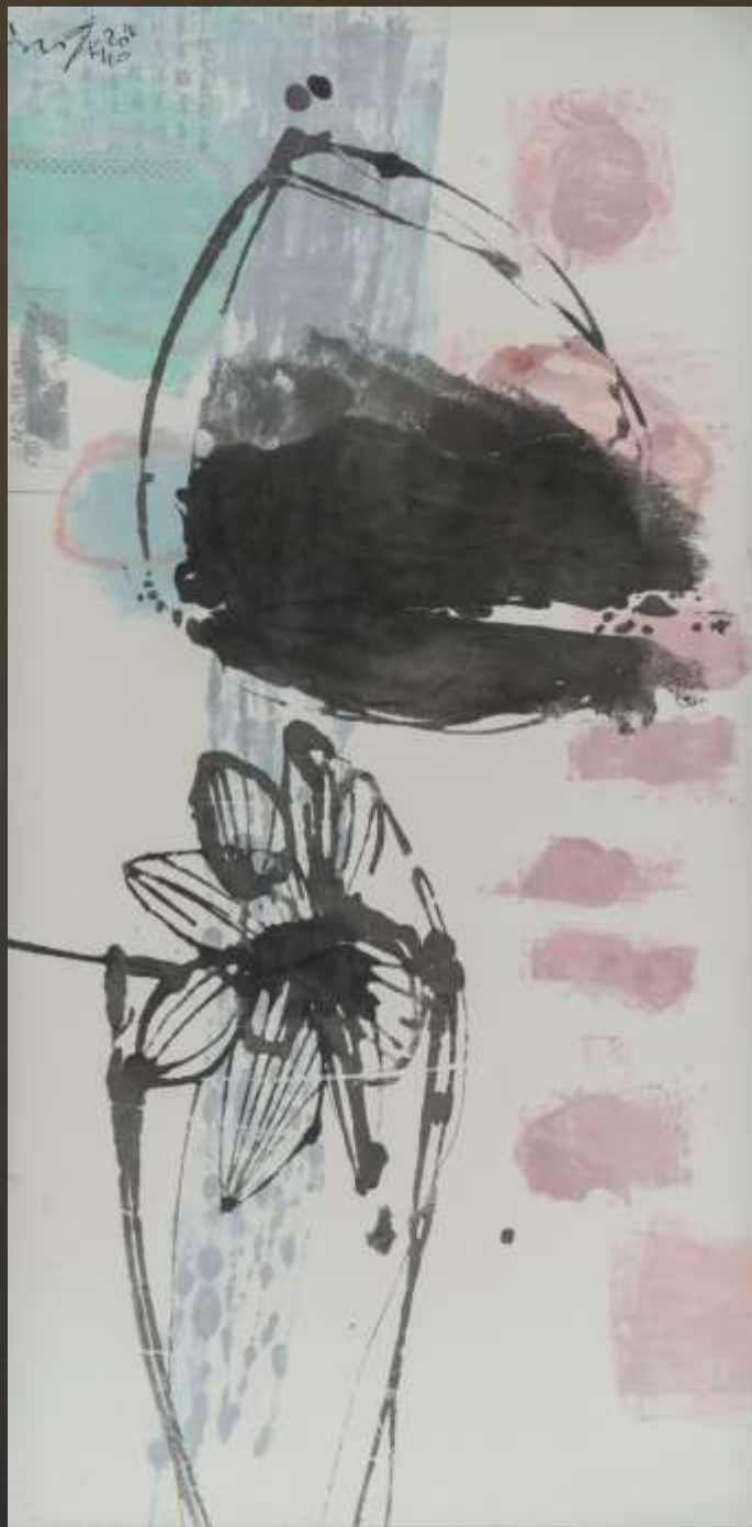
素履之往 90X180cm 複合媒材