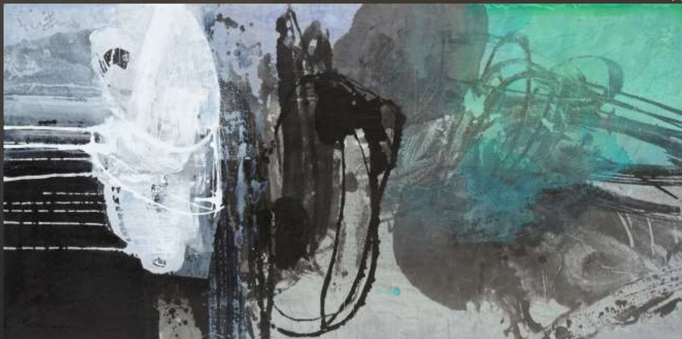
青山見我 88 x 176 cm 複合媒材