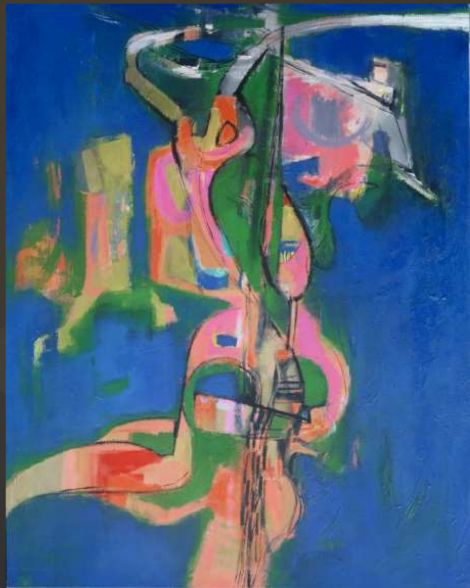
悅 145x183cm 複合媒材