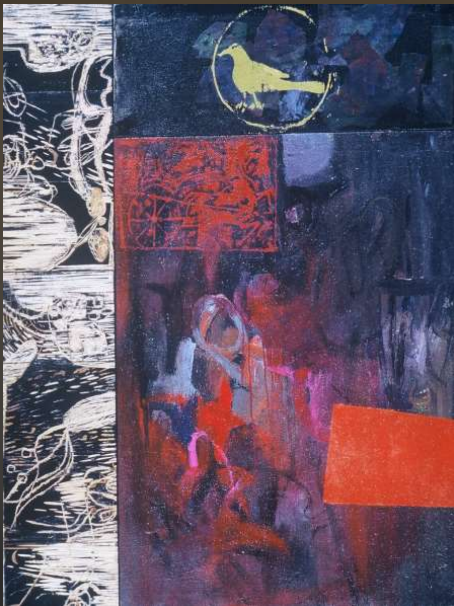
初元系列 97x116cm 複合媒材