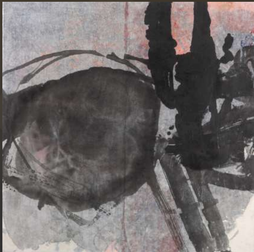
光明磊落 90x90cm 複合媒材