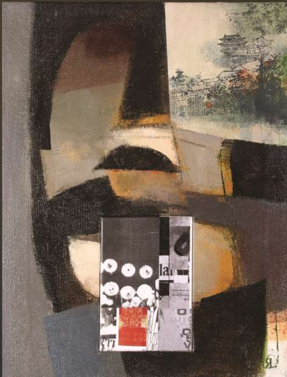
回首風煙 48x63cm 複合媒材