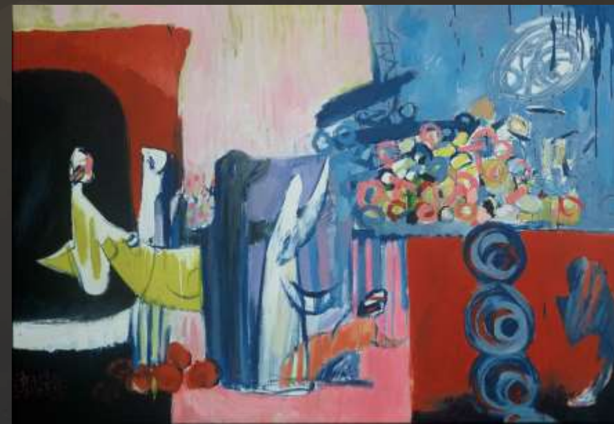
85x112cm 油畫 1988-89