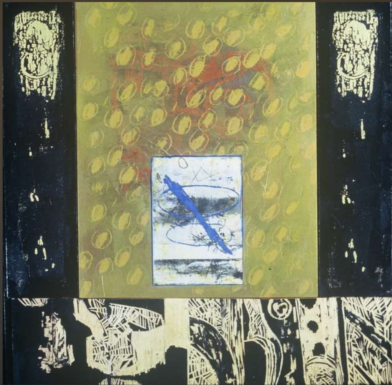
開元天寶 120x120cm 複合媒材