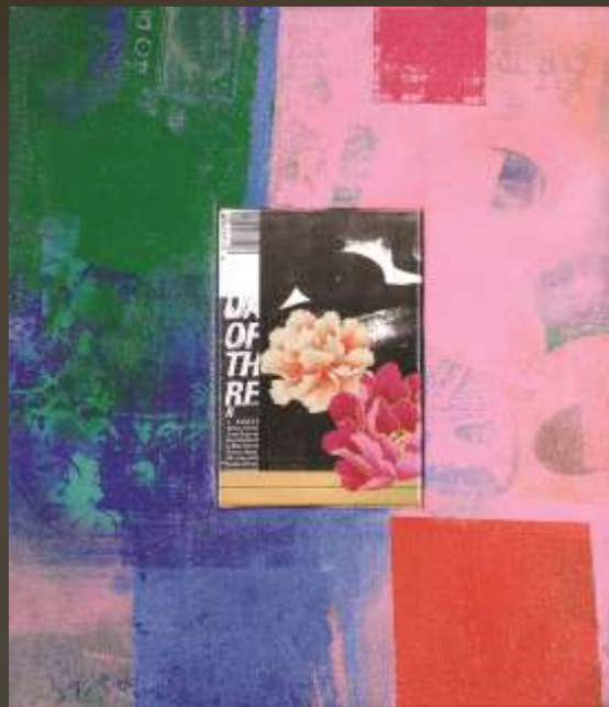
鏡花水月 46x53cm複合媒材