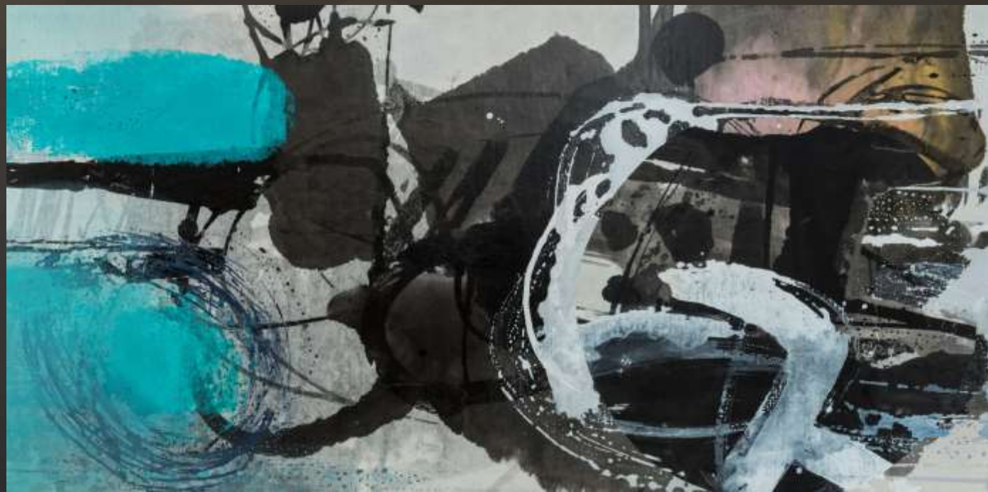
掇青拾紫 90X180cm 複合媒材