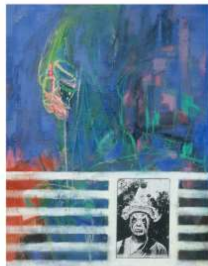
威猛神武者-八家將 182x292cm 複合媒材