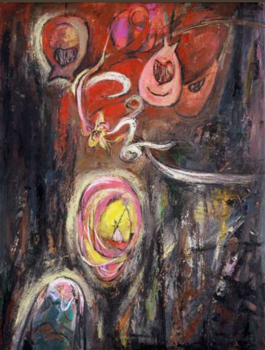
充盈形上空間 119x157cm 複合媒材