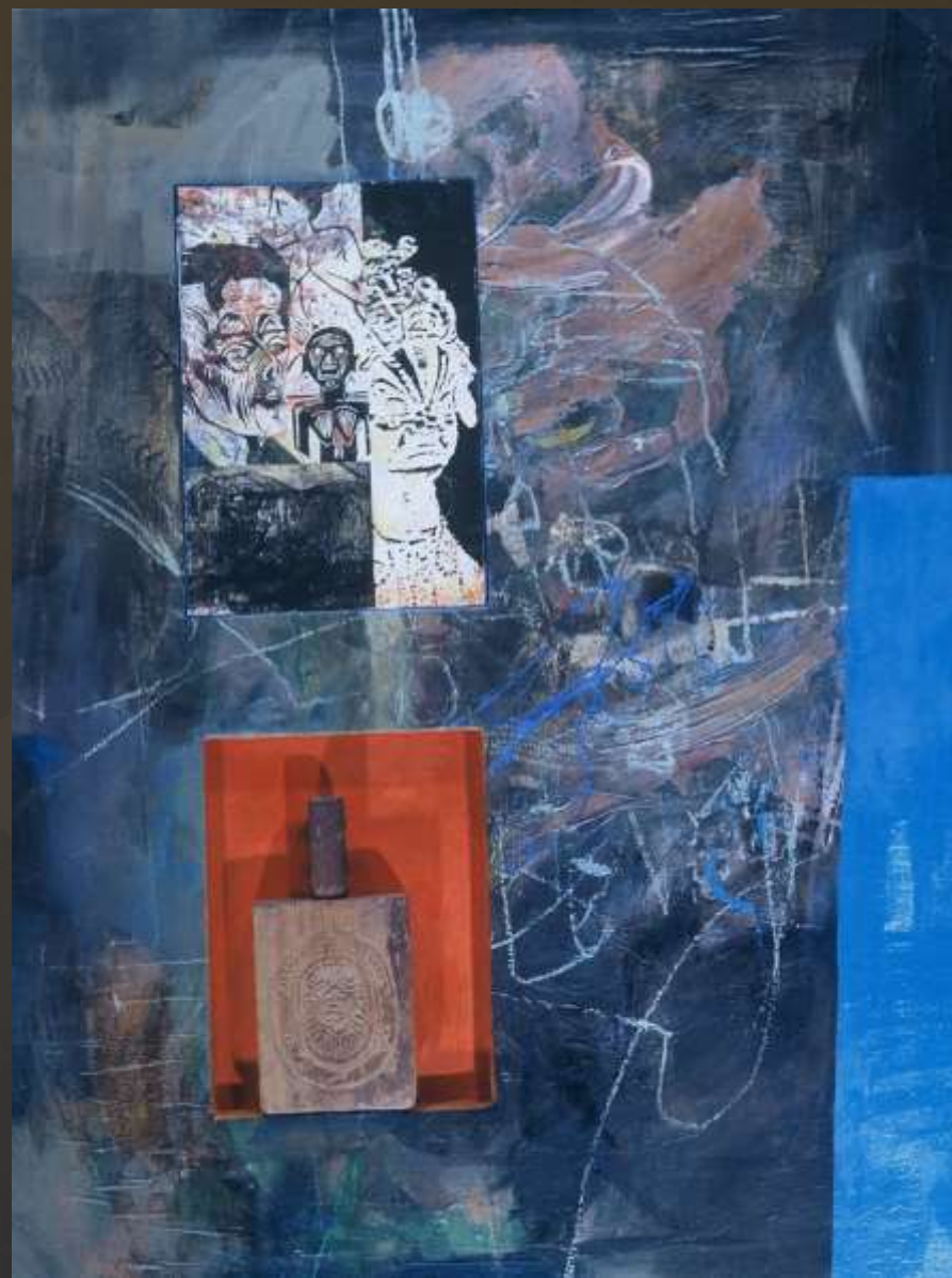
福爾摩沙夜情 97x116cm 複合媒材