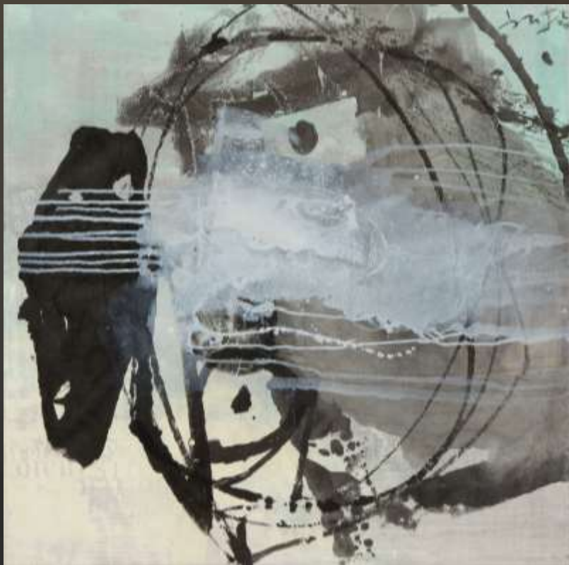
山高水長 90 x 90 cm 複合媒材