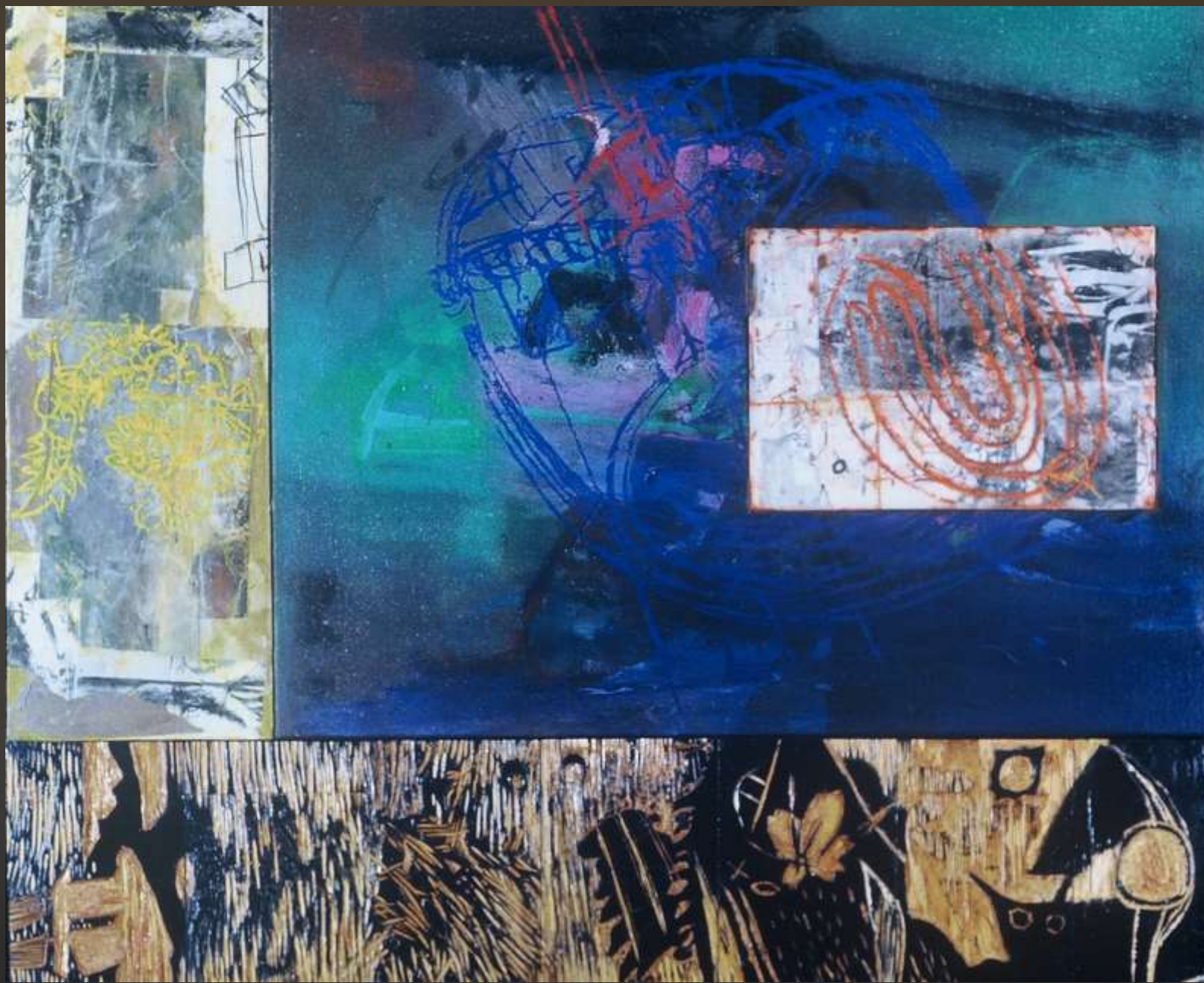
龍朔系列 97x116cm 複合媒材