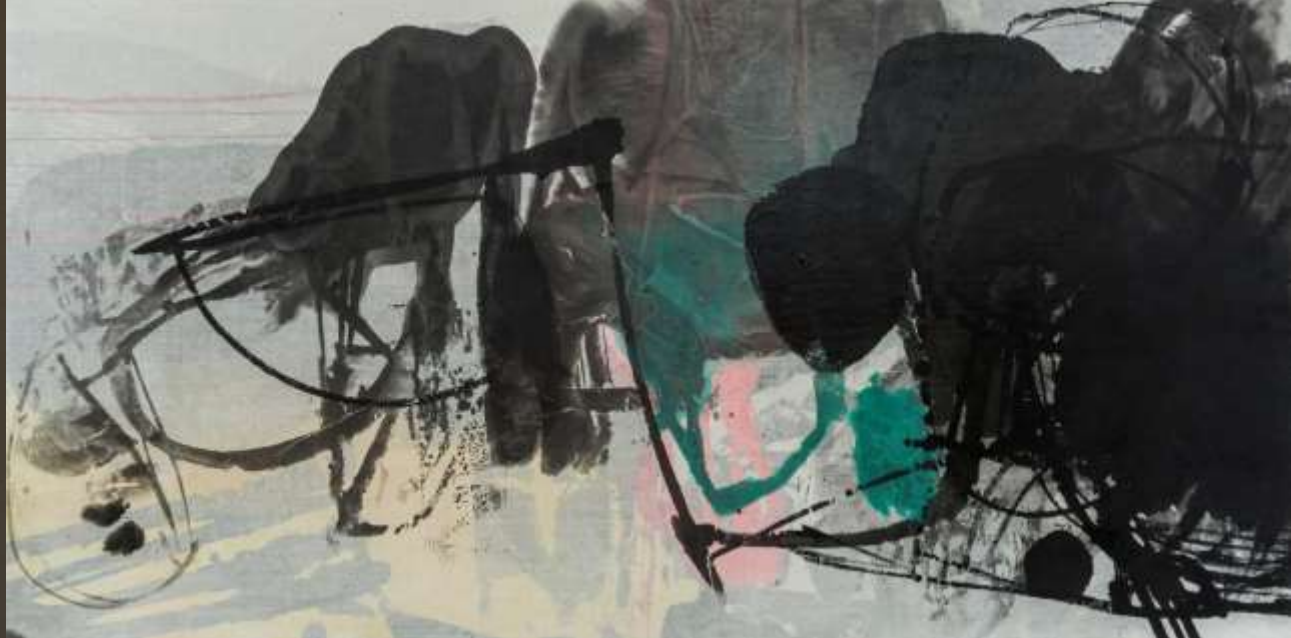
飛泉鳴玉 90X180cm 複合媒材