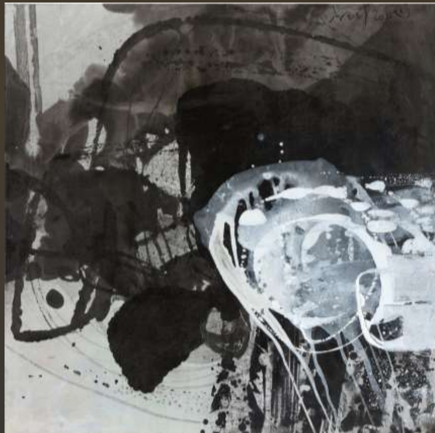
飛泉鳴玉 90 x 90 cm 複合媒材