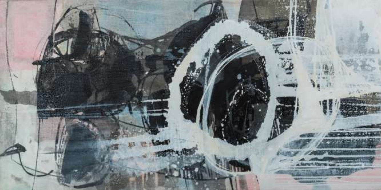
萬物逆旅 90X180cm 複合媒材