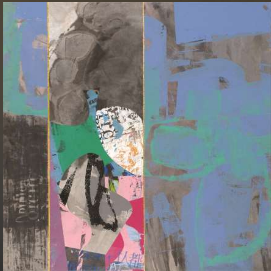
日月得天 60cmx60cm 複合媒材