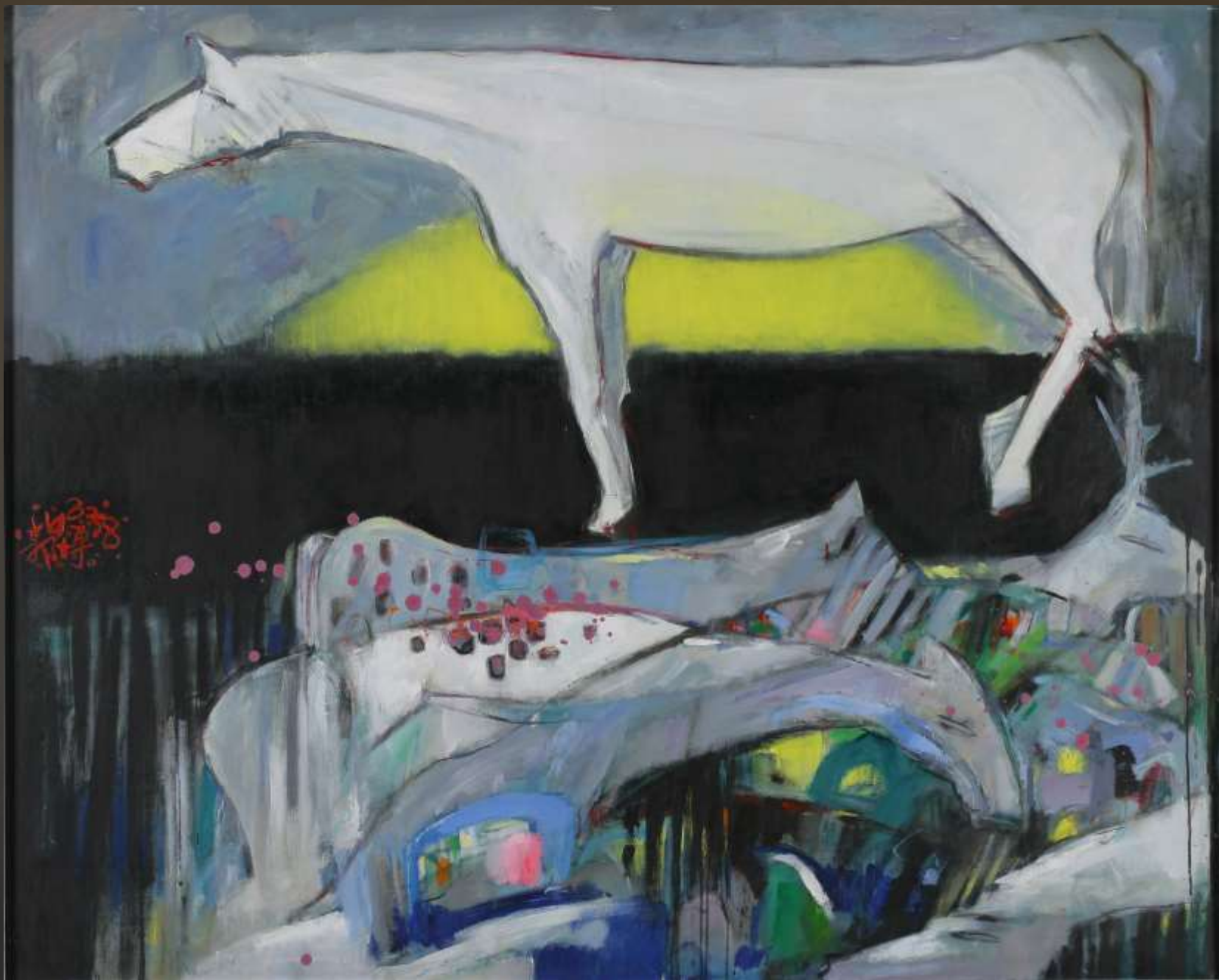
白馬非馬 130x164cm 油畫