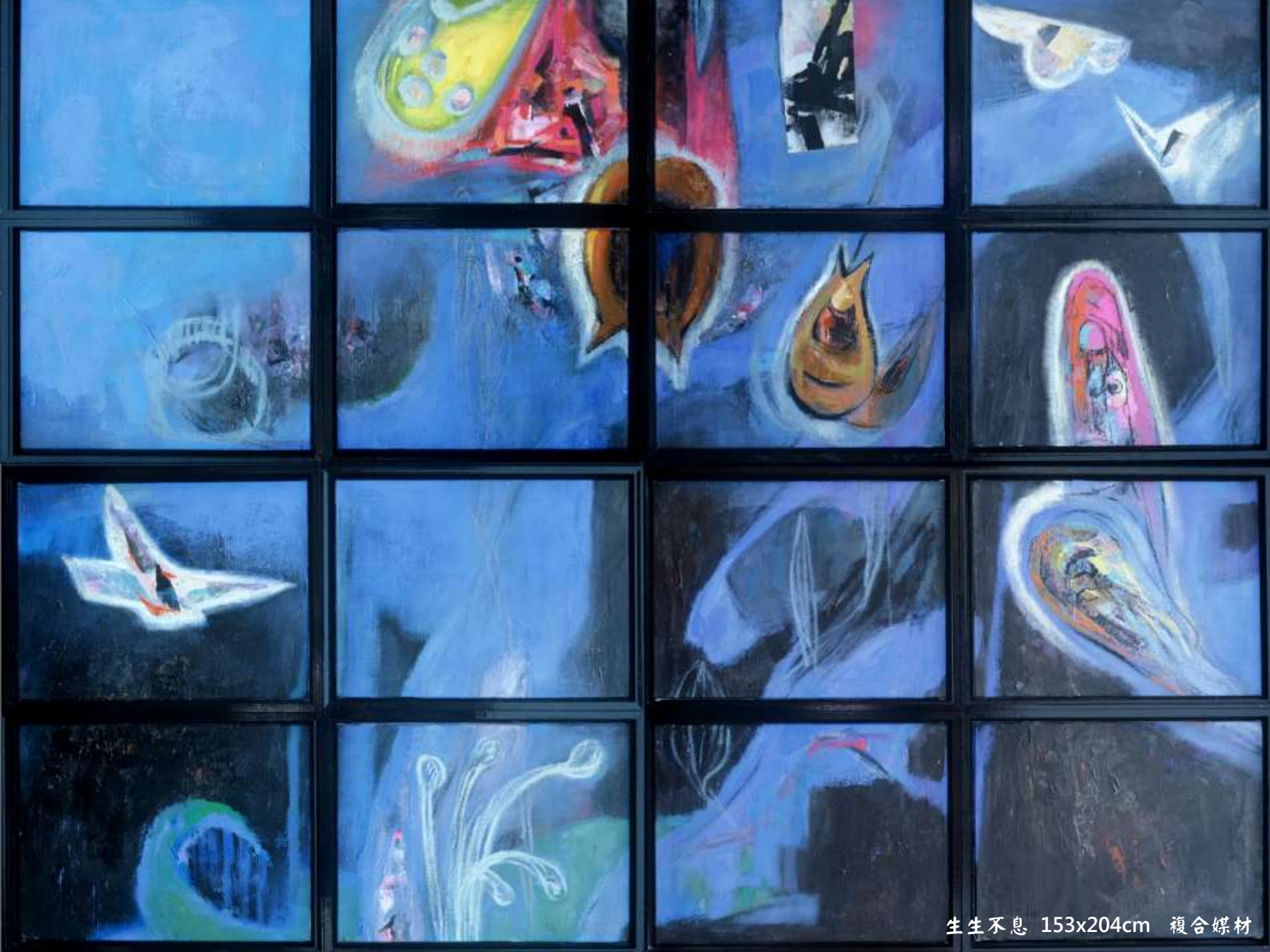
生生不息 153x204cm 複合媒材