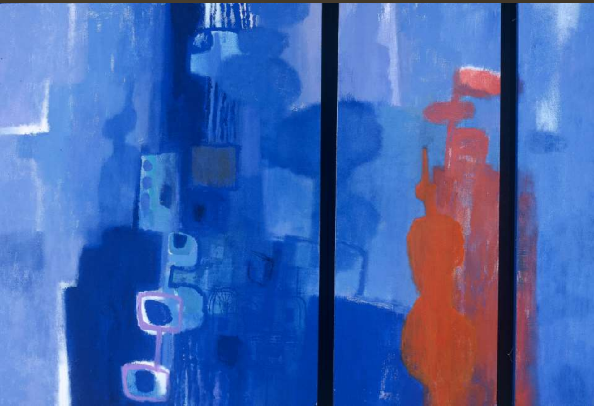
藍色布拉格 91x126cm 複合媒材