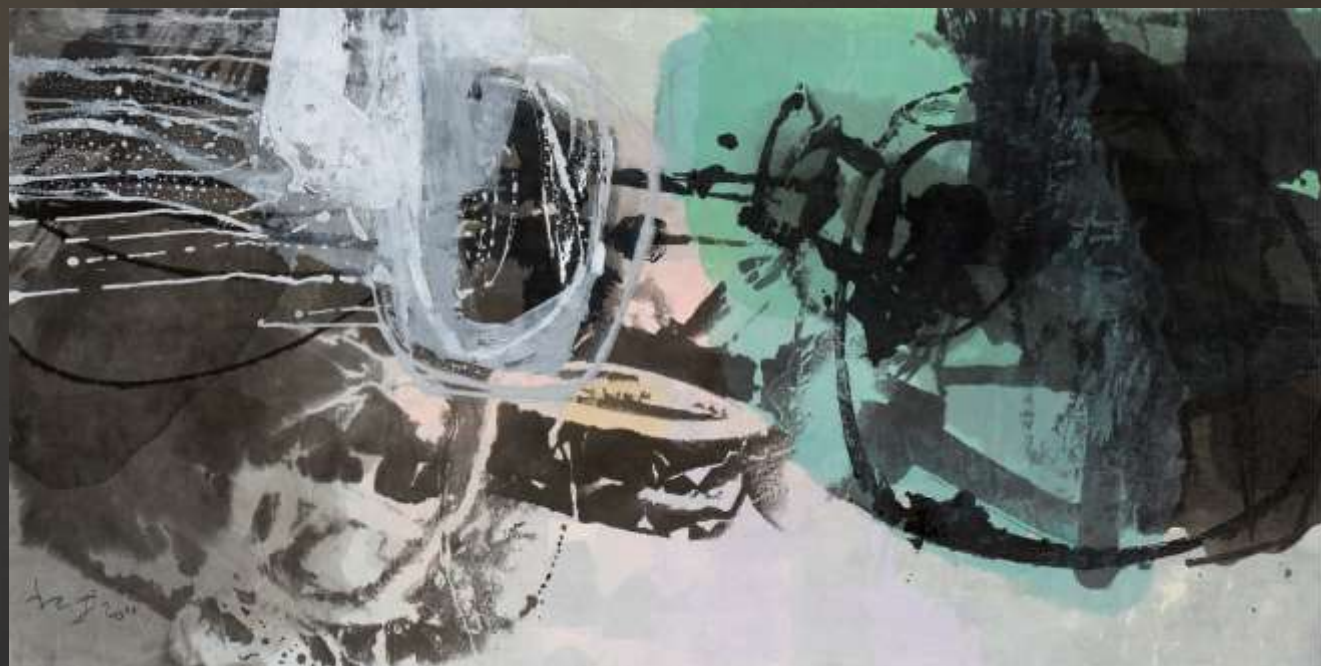
枕流漱石 88 x 176 cm 複合媒材