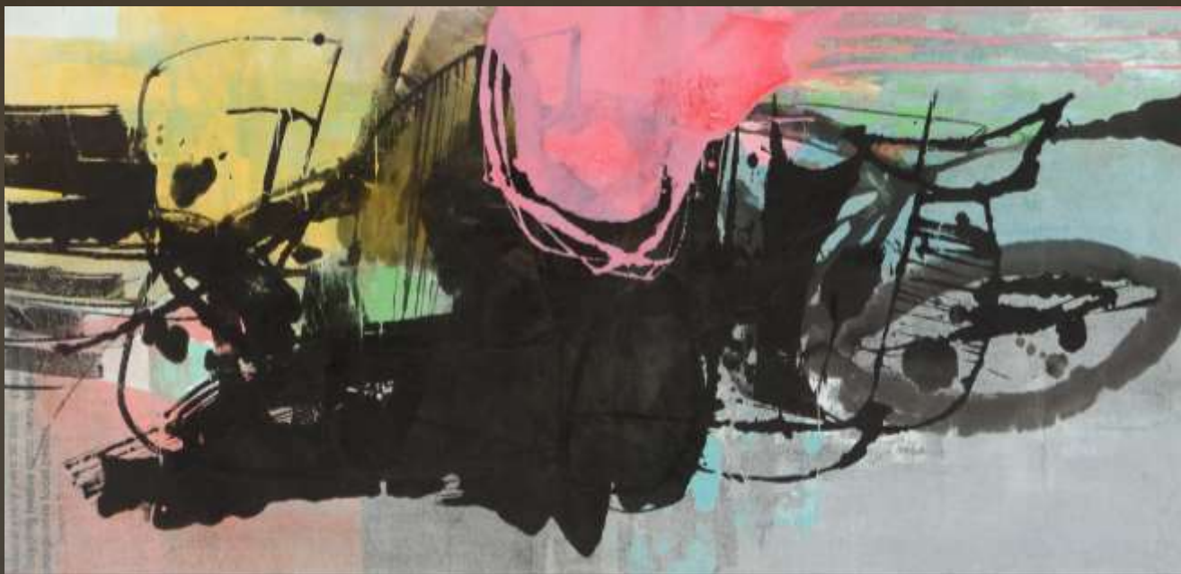
雲高氣靜 88 x 176 cm 複合媒材