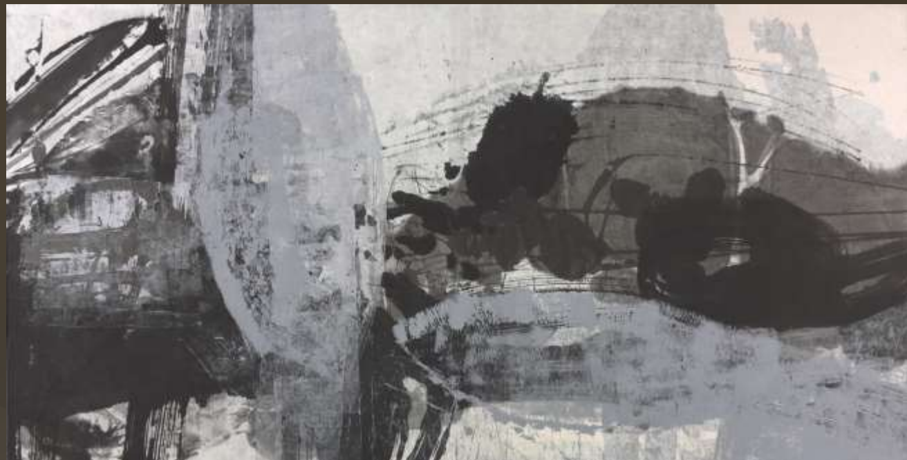
天地和同 88 x 176 cm 複合媒材