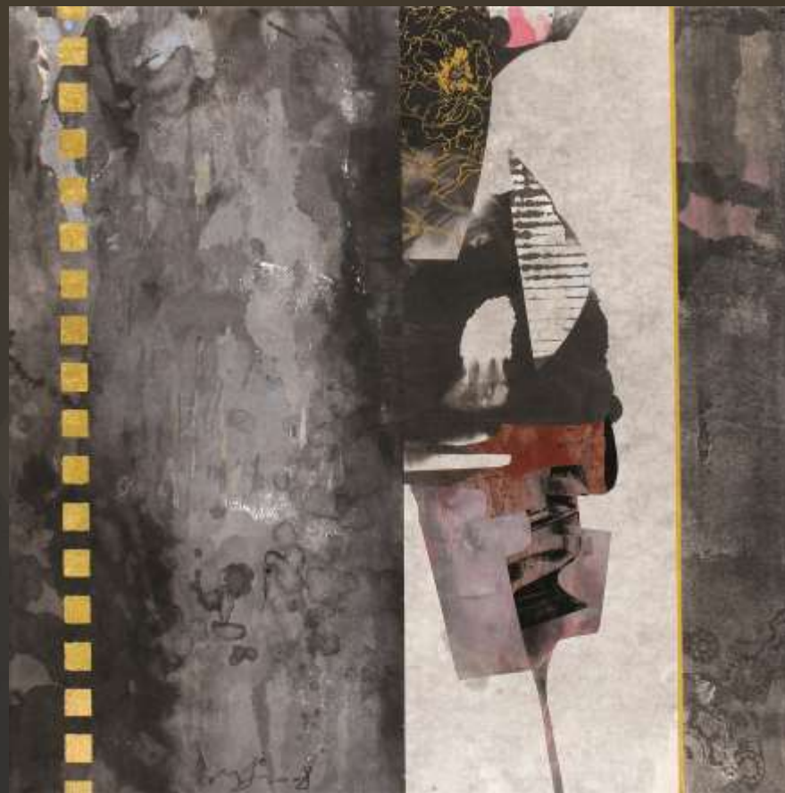
無欲則剛 60x60cm 複合媒材