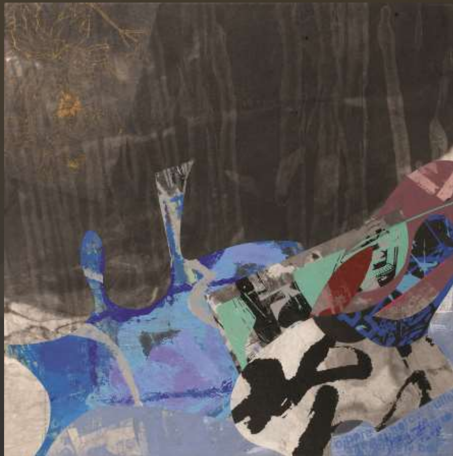
星辰有行 60x60cm 複合媒材