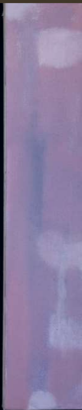
維也納序曲 91x126cm 複合媒材