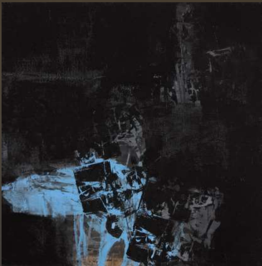
凝思靜聽 90x90cm 複合媒材