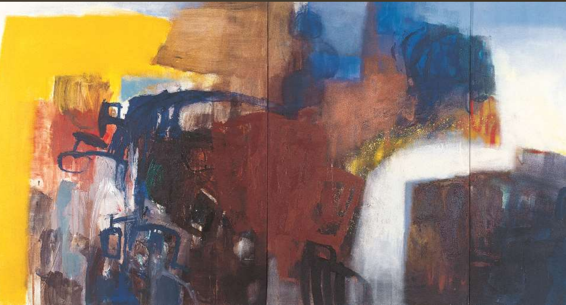
天喻之地西藏情 180x330cm 複合媒材